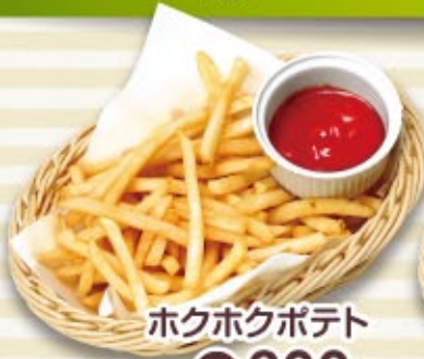
ホクホクポテト 税込 600円