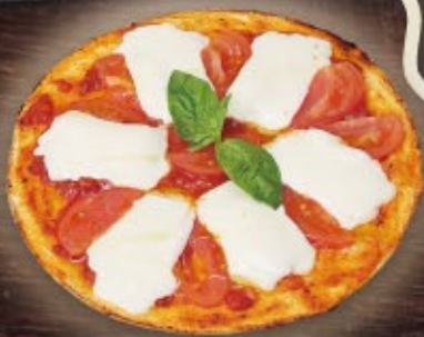
マルゲリータピザ