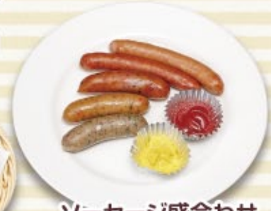
ソーセージ盛合わせ 税込 800円