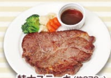
特大ステーキ(約370g) 税込 2,800円