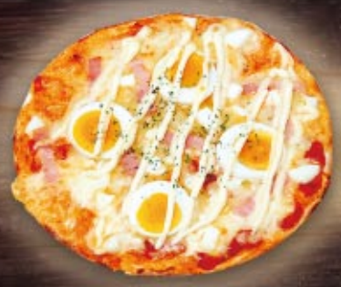
卵とベーコンのピザ