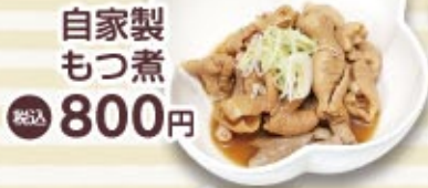
自家製 もつ煮 税込 800円