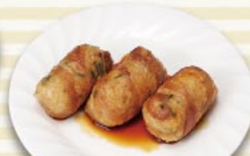
手作り肉巻きおにぎり 税込 700円