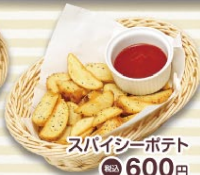
スパイシーポテト 税込 600円