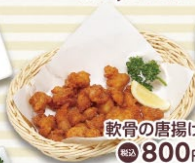
軟骨の唐揚げ 税込 800円