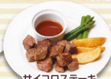
サイコロステーキ 税込 1,300円