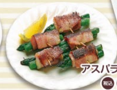
アスパラベーコン 税込 600円