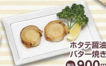
ホタテ醤油 バター焼き 税込 900円