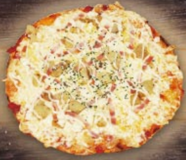
ジャーマンポテトピザ