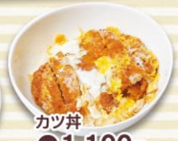
カツ丼 税込 1,100円