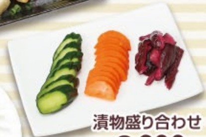
漬物盛り合わせ 税込 600円