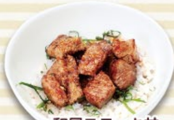
和風ステーキ丼 税込 1,200円