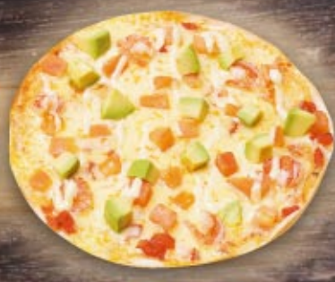
えびとアボカドのピザ