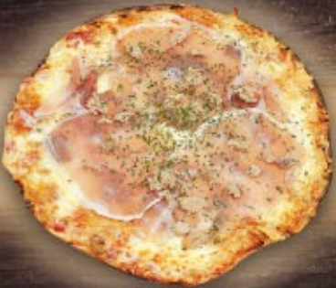
ツナと生ハムのピザ