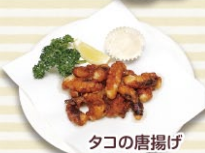
タコの唐揚げ 税込 800円