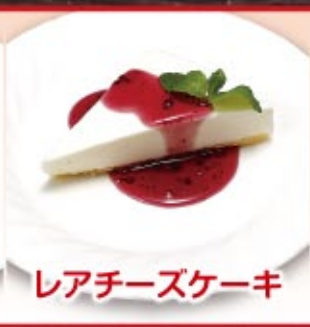
レアチーズケーキ