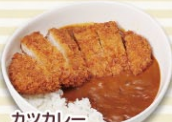
カツカレー 税込 1,300円