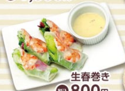
生春巻き 税込 800円