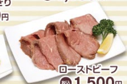
ローストビーフ 税込 1,500円