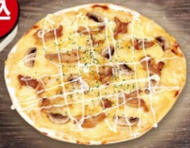
テリマヨチキンピザ